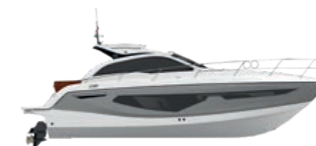
SILVER/GOLD METALLIZED (paint)