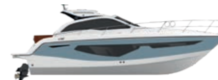
AIR BLUE (paint)