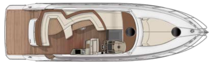
"DOUBLE COCKPIT" VERSION