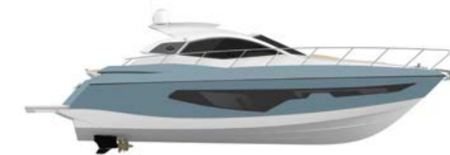
AIR BLUE (paint)