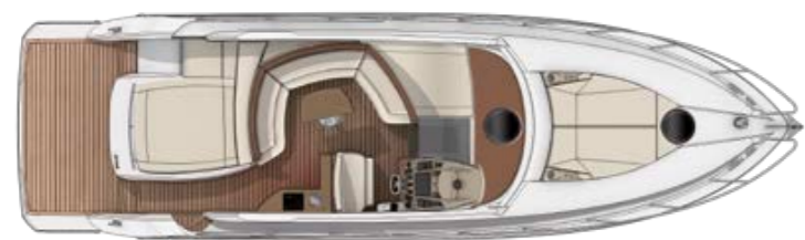
CLASSIC COCKPIT VERSION