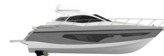
SILVER/GOLD METALLIZED (paint)